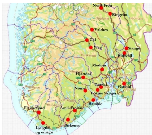
Figur 1. Oversikt over utvalgte studieområder (n=18). Innenfor hvert studieområde ble 30 granbestand i hogstklasse 3 og 4 undersøkt for barknag.

På bakgrunn av registreringene og påfølgende GIS-analyser, utarbeidet vi en statistisk modell som ble brukt til å undersøke hvilke faktorer som kan ha betydning for omfanget av barknagskader på gran, forårsaket av hjort.